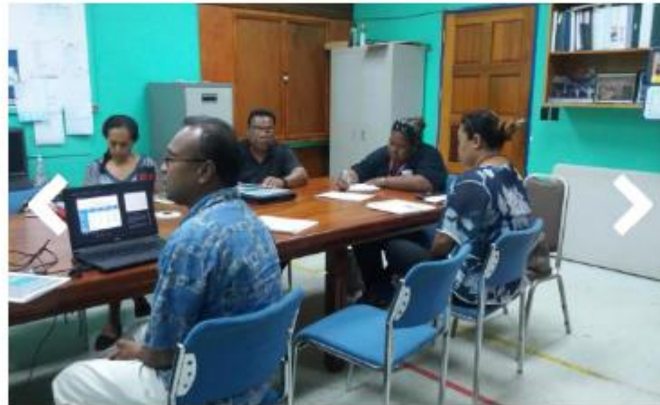
Algunos miembros del Grupo de Trabajo de Control del Tabaco de Palau

Se espera que las Partes en el CMCT de la OMS y —por primera vez desde la entrada en vigor del Protocolo— las Partes en el Protocolo completen y presenten sus informes sobre la aplicación.